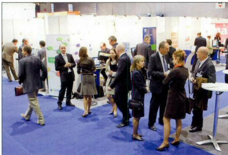
Manageware Le salon a connu un joli succès.

de présenter aux clients potentiels un condensé de ce qu'ils cherchent. On ne va jamais avoir 500 exposants sur cette thématique-là.»