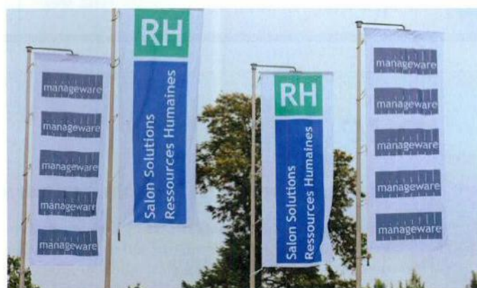
Pour la troisième année consécutive, le Salon Solutions RH aura lieu à Palexpo (Genève).