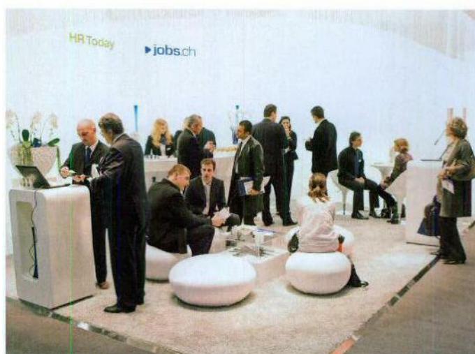
La plateforme jobs.ch va présenter les derniers outils qu'elle vient de lancer.