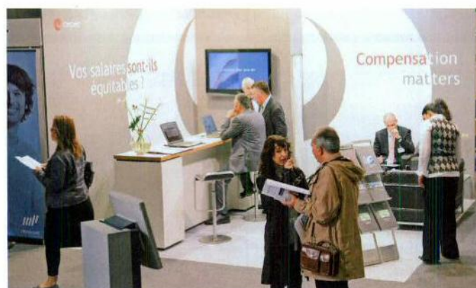
Cepec mettra l'accent sur la comparaison et la gestion de salaires.