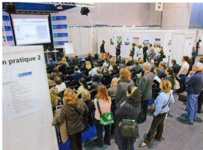
Comme l'an dernier, l'un des temps forts de ces rencontres devrait être les conférences.