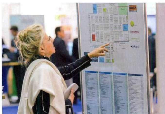
Le nombre d'exposants s'annonçait au même niveau qu'en 2008, soit un peu plus de 150 stands.