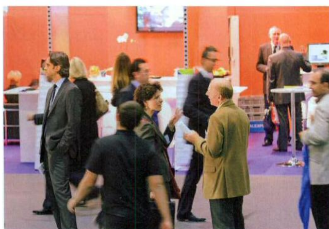
La manifestation promet d'être professionnelle et riche en rendez-vous de haute tenue.